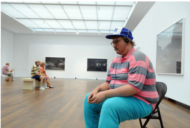
Focus sur Duane Hanson