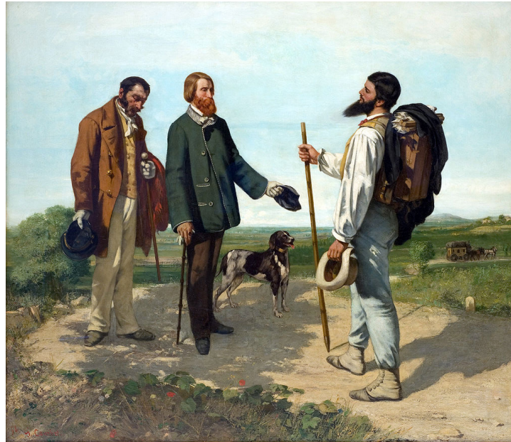
Gustave Courbet "La rencontre ou bonjour Monsieur Courbet" 1854.