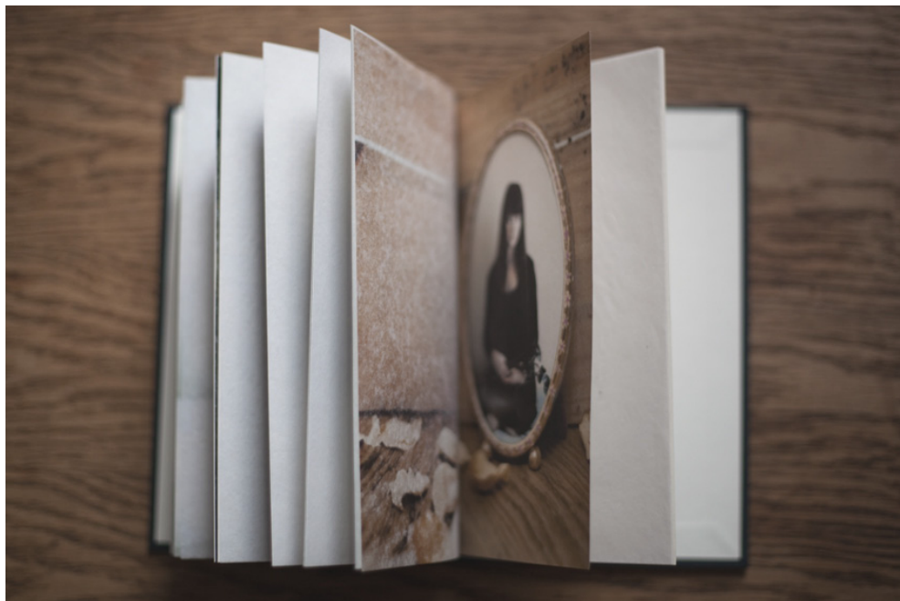
Charity Thomas, Ripples , livre, 2013