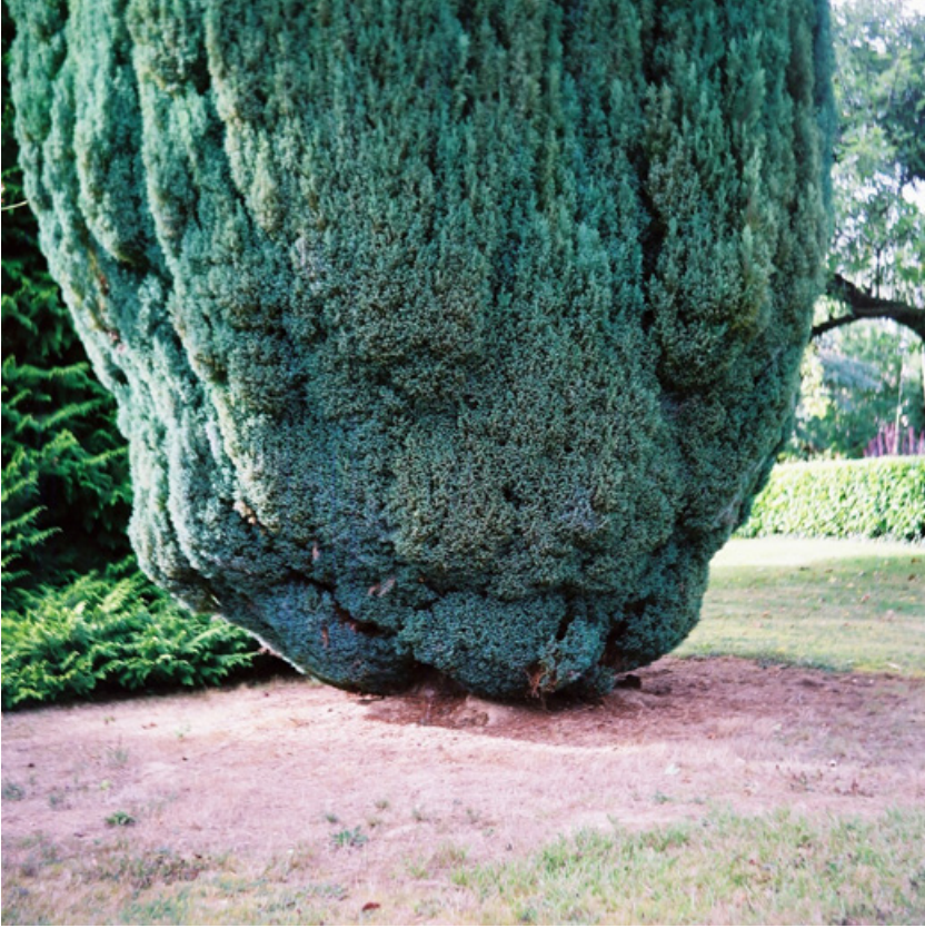
Florentine Charon, Pression inversée , photographie, 2013