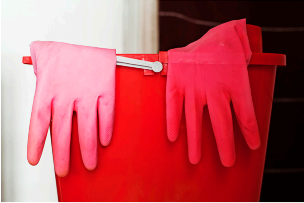
Ignacio Gómez Sales, L'étrangeté de la vie domestique , tirage lambda, 2013