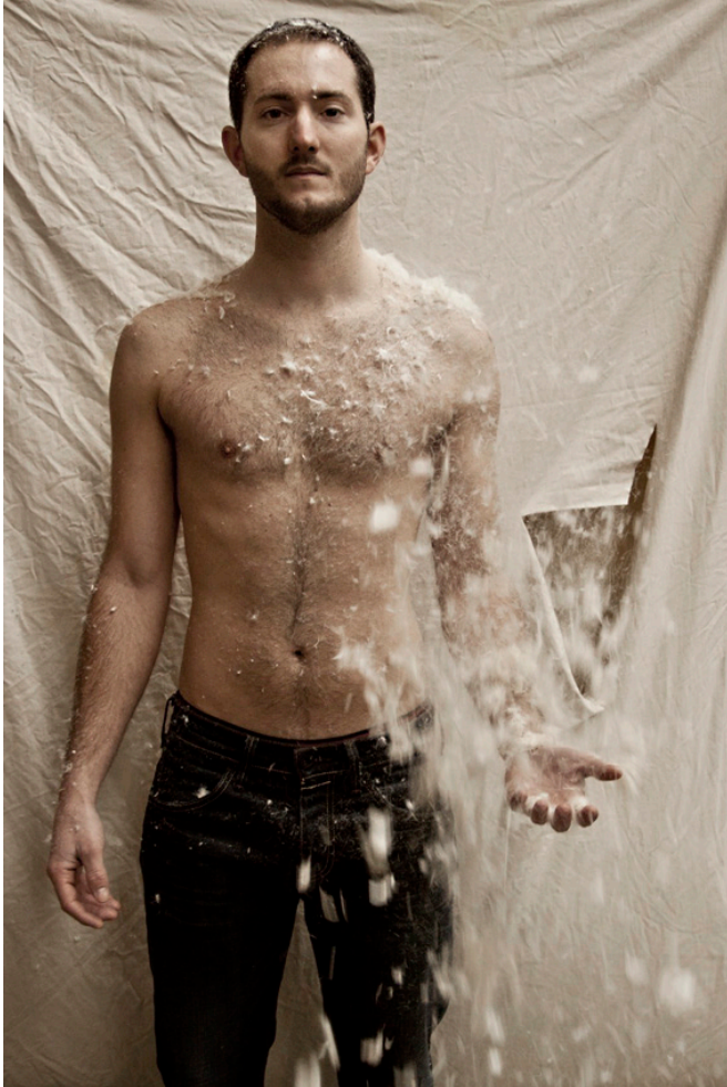
Lucile Ketterlin, From dust to what ? , tirage numérique, 2013