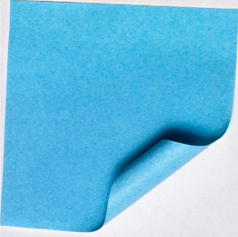
Paul Chapellier, Bleu pastel , C-Print, 2013