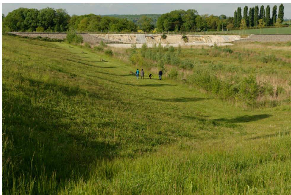
Marie-Claire Saille, Paysages en cours , Magny-Le-Hongre, tirage sur papier photo glacé, 2013