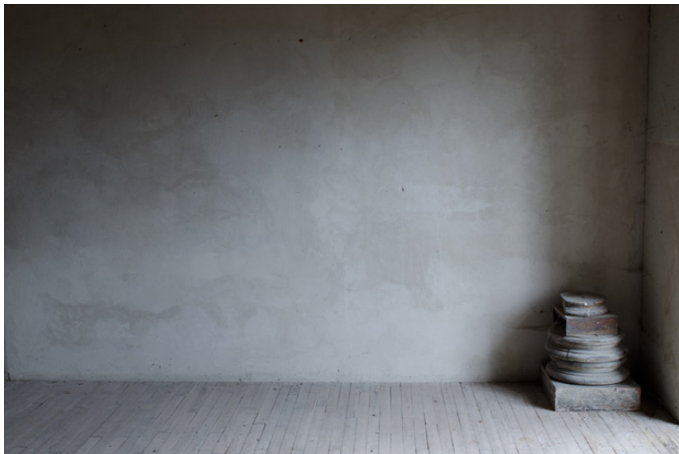
Julia Dupont, Rémanence , 2012, livre